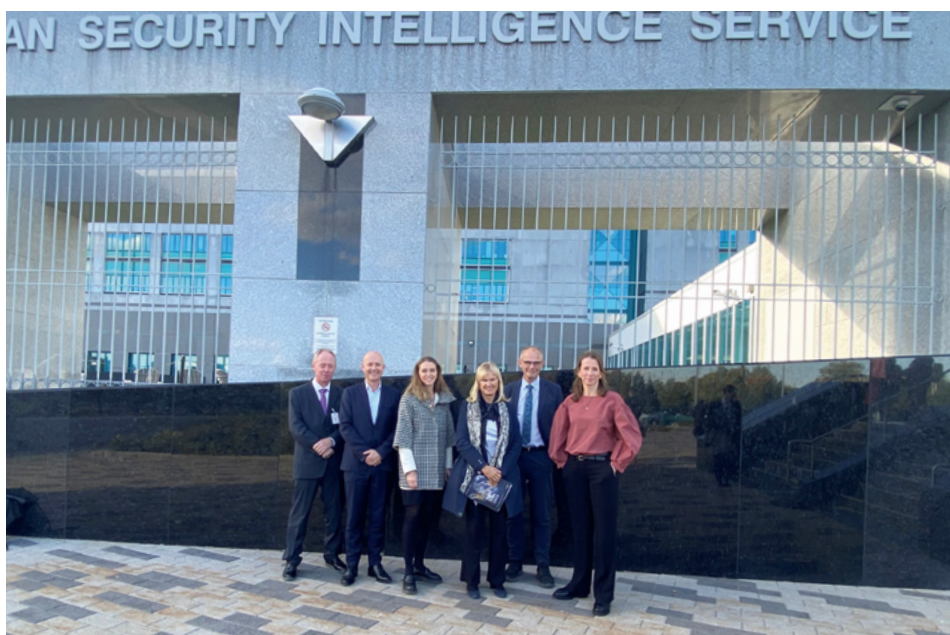
Seks av de daværende medlemmene av EOS-utvalget deltok på en studietur for å besøke blant annet kontrollorganet National Security and Intelligence Review Agency (NSIRA). Bildet er tatt utenfor Canadian Security Intelligence Service (CSIS).